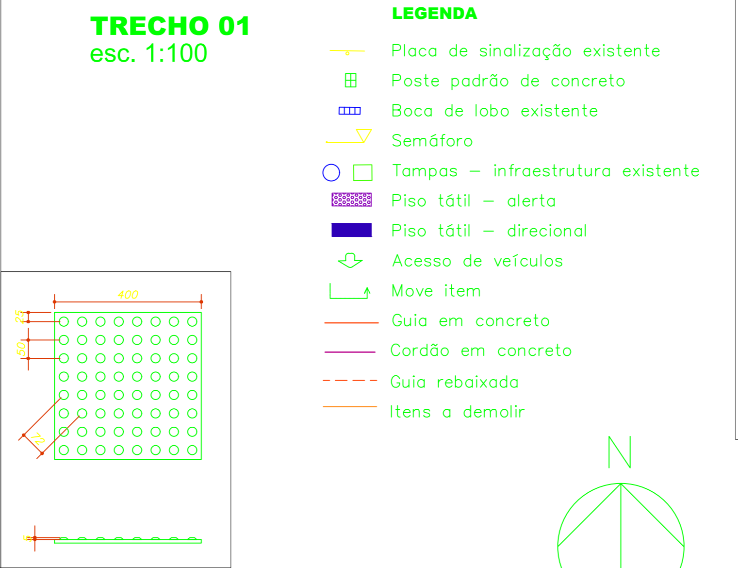
DETALHE - PISO ALERTA esc. 1:10